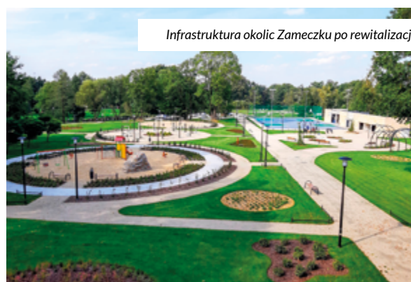
Infrastruktura okolic Zameczku po rewitalizacji.

powinien znacznie intensywniej uczestniczyć w życiu lokalnej społeczności. Rozumieli to również sami mieszkańcy, którzy uczestnicząc w konsultacjach społecznych w ramach przygotowywania „Lokalnego Programu Rewitalizacji” zwrócili uwagę na konieczność odbudowy zameczku oraz wyposażenia jego otoczenia w bogatą infrastrukturę. W ten sposób wyłoniła się koncepcja zagospodarowania zabytkowego dworu w Leszczynach oraz jego otoczenia, która otrzymała nazwę „Rewitalizacja społeczna i infrastrukturalna poprzez remont zabytkowego zameczku i jego otoczenia w Czerwonka-Leszczynach”. Po jej zatwierdzeniu wykonany został projekt