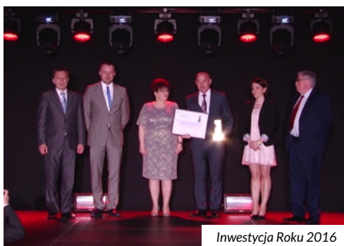
Inwestycja Roku 2016

waną spółkę Inwest-Park z kompleksem budynków, w których znajdują się sale konferencyjne. Często organizowane są tam szkolenia i wydarzenia kulturalne. Spółka z dobrym skutkiem realizuje również projekty na rzecz lokalnej społeczności, takie jak: zagospodarowanie terenów rekreacyjnych, miejsc na wypoczynek rodzinny z atrakcjami dla najmłodszych. Organizuje liczne festyny, imprezy integracyjne (sadzenie drzew z udziałem dzieci i władz miasta),