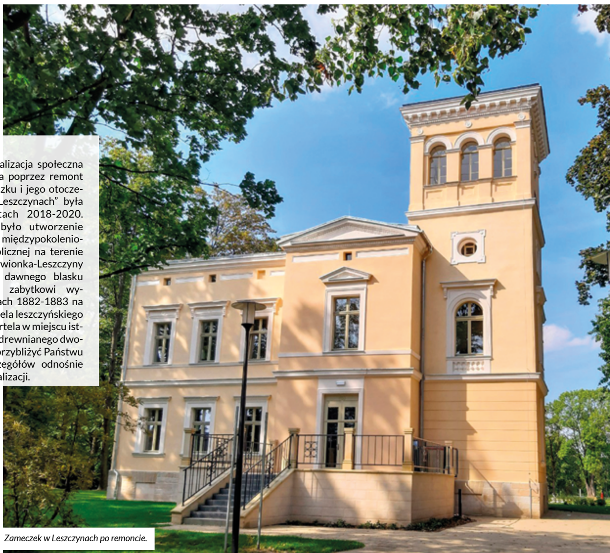
Zameczek w Leszczynach po remoncie.