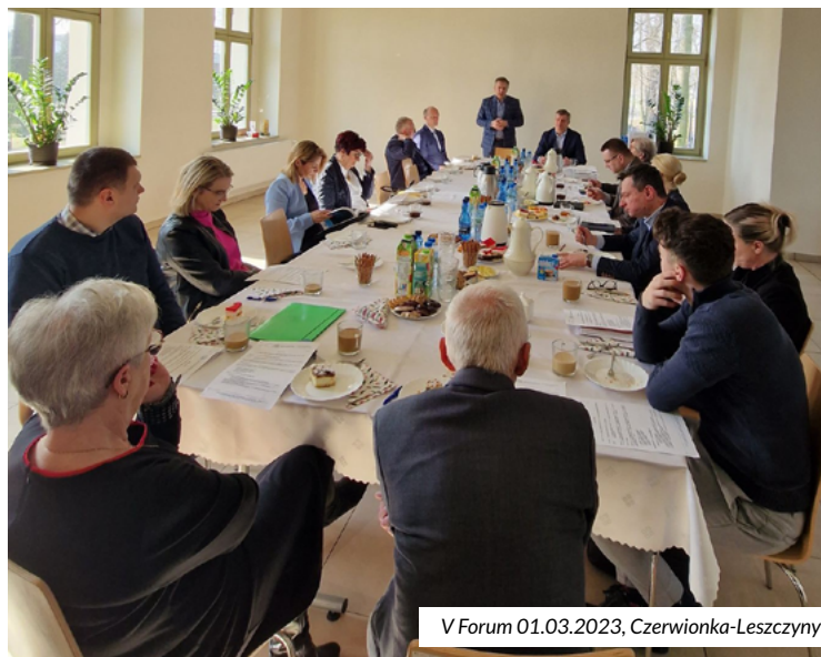
V Forum 01.03.2023, Czerwionka-Leszczyny

» 13 października 2022 r. „Forum” odbyło się w Urzędzie Miejskim w Piekarach Śląskich. Spotkanie swoją obecnością zaszczyliła Pani Senator RP Joanna Sekuła . Uczestnicy mieli okazję zobaczyć prezentację systemów obioru segregowanych odpadów dla komunalnych budynków wielorodzinnych. Dodatkowo podczas spotkania wystąpił przedstawiciel BGK.