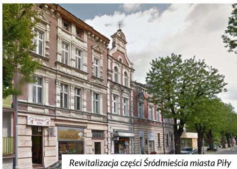
Rewitalizacja części Śródmieścia miasta Piły