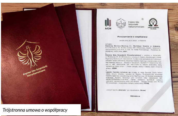
Trójstronna umowa o współpracy