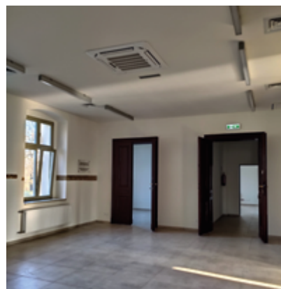
Odnowione wnętrza Zameczku w Leszczynach.