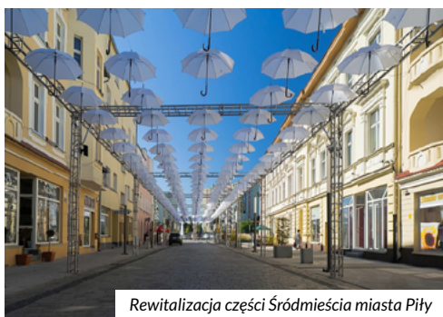
Rewitalizacja części Śródmieścia miasta Piły