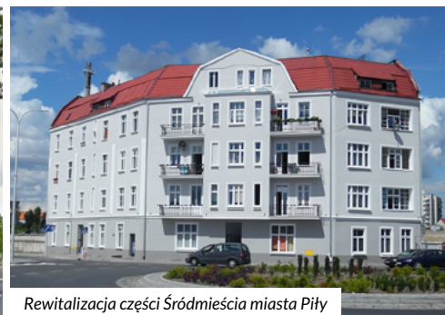
Rewitalizacja części Śródmieścia miasta Piły