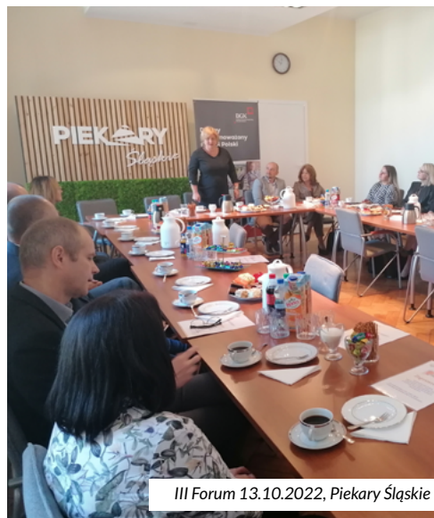
III Forum 13.10.2022, Piekary Śląskie