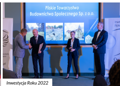
Inwestycja Roku 2022

z Banku Gospodarstwa Krajowego w wysokości około 34,6 mln zł. Do użytku oddano 564 mieszkania, a w 2023 roku planowane jest oddanie jeszcze kolejnych 33.