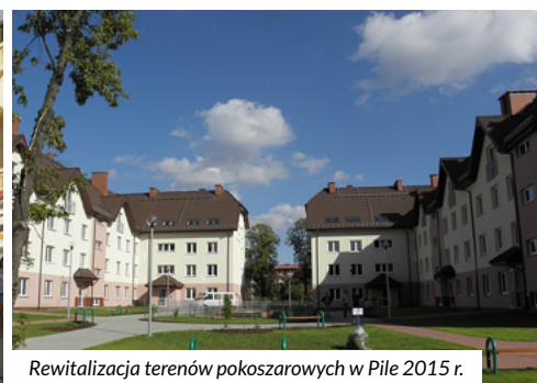
Rewitalizacja terenów pokoszarowych w Pile 2015 r.

Dzięki dobremu zarządzaniu i wykwalifikowanej kadrze, oraz wsparciu – Gminy Piła i BGK W-wa udało się zrewitalizować tereny powojenne w rejonie ulic Podchorążych-Bydgoskiej (obszar o powierzchni 7,79 ha). Dodatkowo zaadoptowano 8 obiektów na budynki mieszkalne, 1 na użytkowy (biblioteka i prokuratura) oraz wykonano 5 nowych. Zainwestowano około 68,5 mln zł pozyskując preferencyjne środki w ramach Programów Rządowych