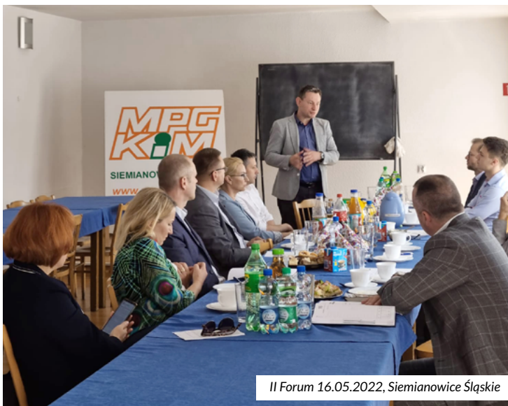
II Forum 16.05.2022, Siemianowice Śląskie