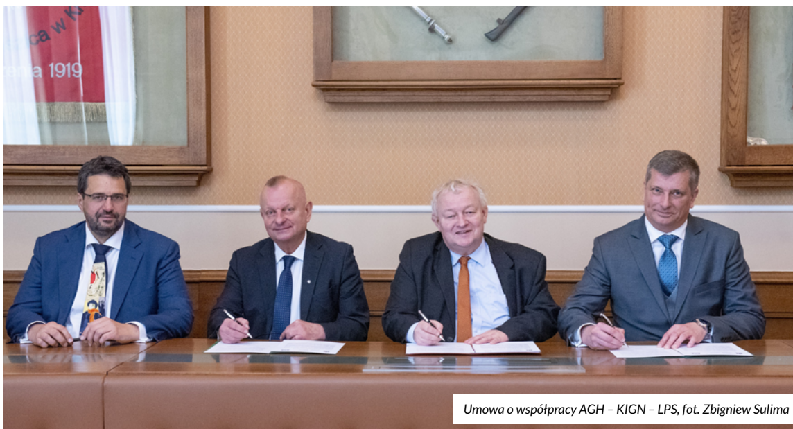
Umowa o współpracy AGH – KIGN – LPS