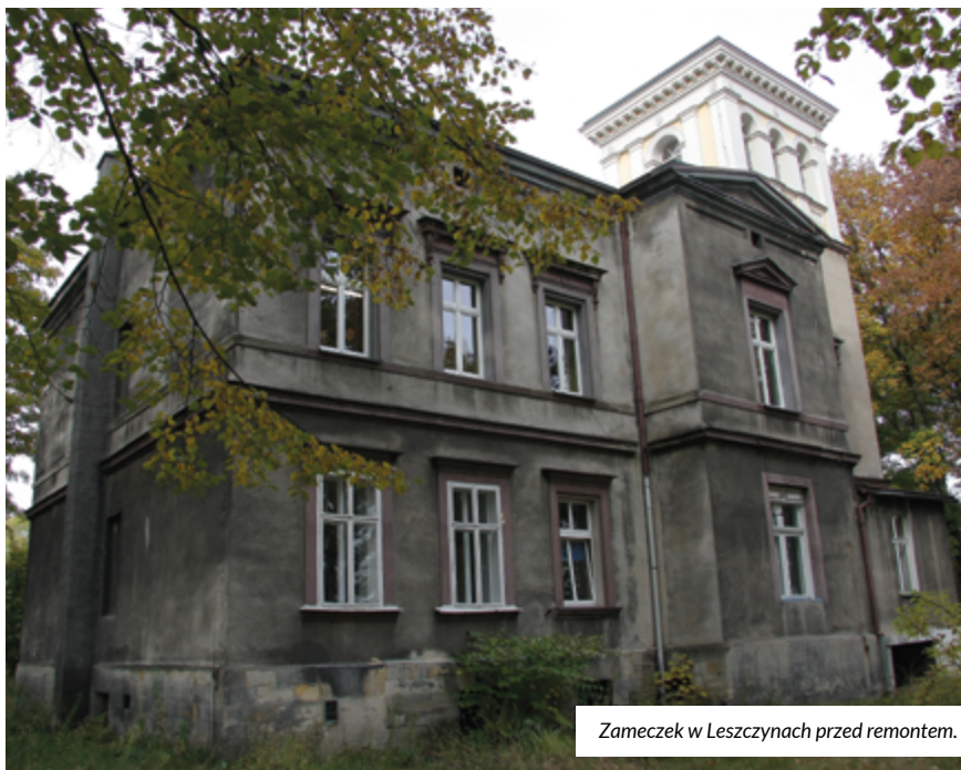
Zameczek w Leszczynach przed remontem.