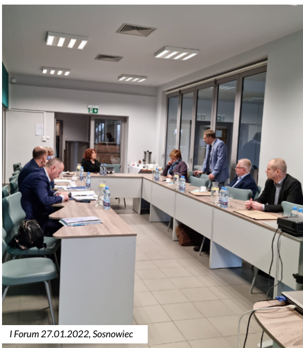
I Forum 27.01.2022, Sosnowiec

FORUM ZARZĄDCÓW GMINNYCH ZASOBÓW MIESZKANIOWYCH