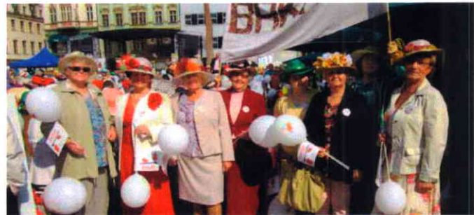
Reprezentacja Klubu Seniora na Marszu Kapeluszy 25.09.2015