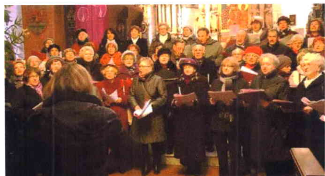
Kolędowanie w Kościele Garnizonowym