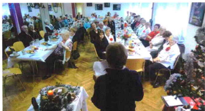
Wigilia Klubowa i podsumowanie Projektu ISKRY z rozdaniem dyplomów