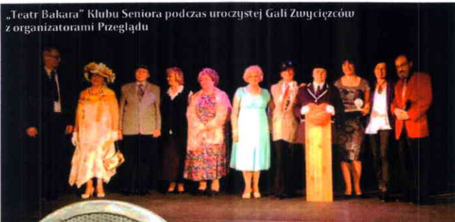
„Teatr Bakara” Klubu Seniora podczas uroczystej Gali Zwycięzców z organizatorami Przeglądu