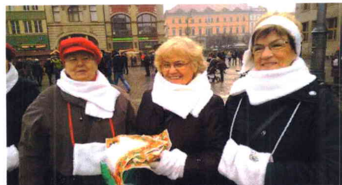
Grupa teatralna podczas Happeningu w Rynku